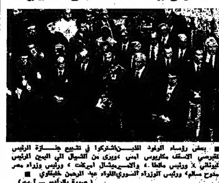
بعض رؤساء الوفود الذين شاركوا في تشييع جثة الرئيس المكاريوس في قبره في جبل جرزيرة قبرس

«مكاريوس هي» كانت هذه واحدة من العبارات التي أطلقها مشيوع الرئيس القبرسي امس وهم يلقون نظرة الدواع الأخيرة على رئيسهم الراحل في الوقت الذي تولاه فيه الجزيرة مزيداً من الغموض حول مستقبلها السياسي. وقد حضر جثمان الرئيس القبرسي مكاريوس في مدين جيل في قبرس من قبل ١٧ دولة. ويقع القبر في اقليم جيلان في قبرس الذي تولى امره في يوم اليريدام المين من ٦٣ عاماً. بالقرب من